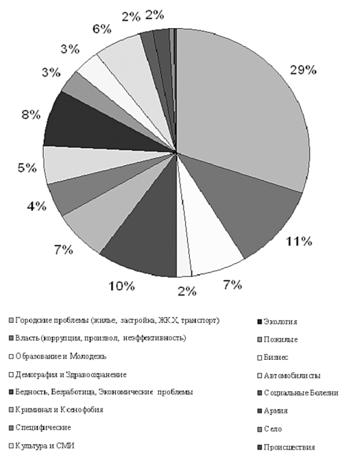
Рейтинг проблем, вызвавших протестные акции

К вопросам местного значения отнесены также целый ряд функций социальной защиты, образования и здравоохранения. Им, в частности, предписано обеспечивать малоимущих граждан жильем, выдавать субсидии, организовывать опеку и попечительство. Однако гораздо важнее то, что руководители муниципальных образований осознают свою ответственность за жизнь поселения в целом, стремясь решать возникающие проблемы, причем не всегда в соответствии со ограниченным перечнем