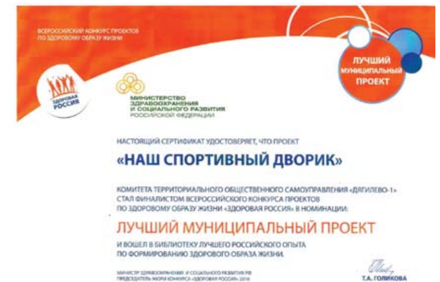
Сертификат ТОС «Дяги́лево-1»

Активисты ТОС готовы взять на себя координацию данного проекта непосредственно в комитетах ТОС. Обсуждаются вопросы создания и популяризации сайтов ТОС среди населения, популяризации таких информационных сервисов как порталы государственных и муниципальных услуг, сайты органов власти. Важное место в реализации проекта «Информатизация ТОС» занимает обучение интернет-пользованию актива. Каждый обучаемый активист становится носителем информации и навыков, который способен в дальнейшем передать другим жителям, повысить уровень компьютерной и информационной грамотности всех жителей территории.